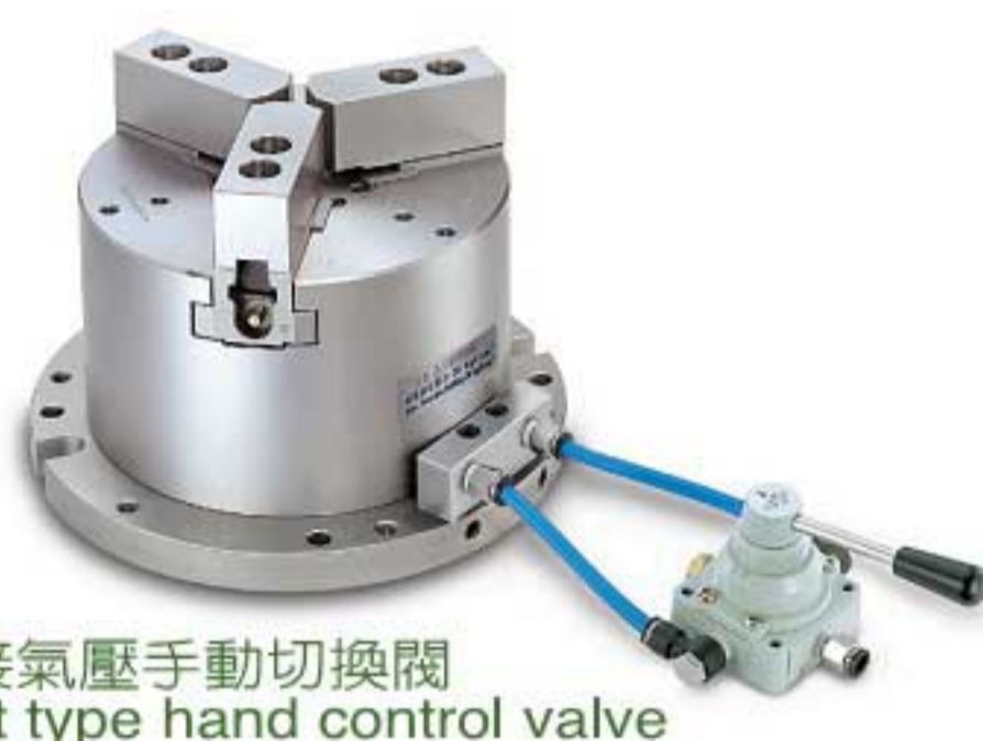
外接氣壓手動切換閥 Split type hand control valve

氣壓切換閥連接方式 / 特殊附件 Examples of Attaching Pneumatic Manual Switch / Optional Accessories