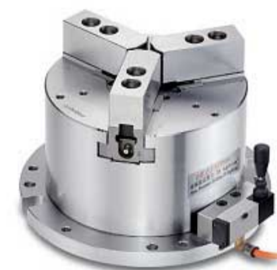
氣壓手動切換閥 Adherent type hand control valve